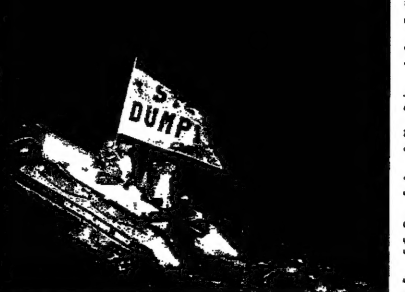
قرب حطاي صيراج حيفا لتخزين نفايات كيميائية من مصنع الفلزات السامة بالبحر

بي. ام. دبليو، التي كانت مصنعة جيبس، سولي 24 مليون الاستثمار الإيطالية في الشرق الاوسط. وفي عام 1997 باعت بي. ام. دبليو 5000 وحدة بقيمة 410 ملايين دولار.